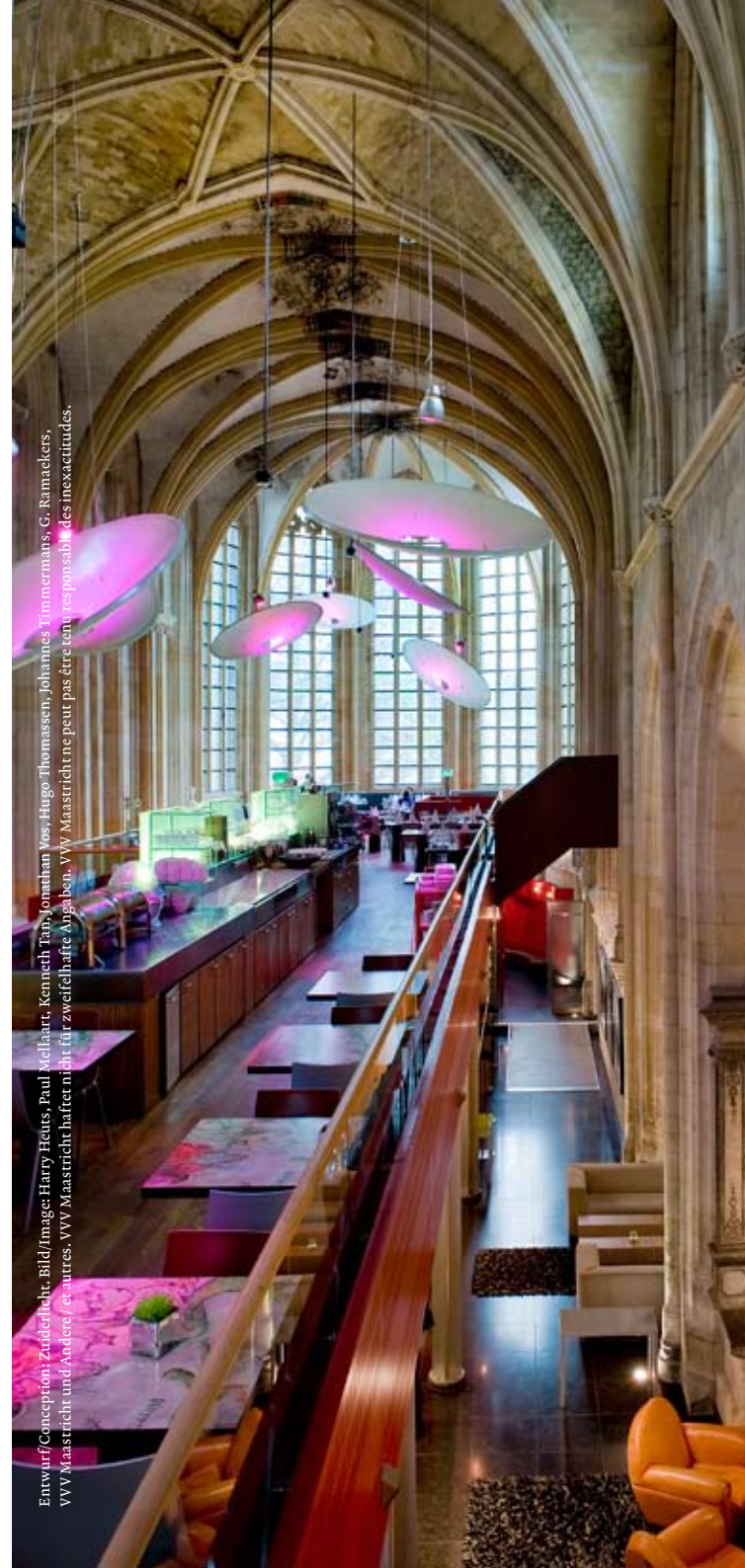
Eenworf/Conceptie: Zuidericht, VVV Maastricht haftet nicht für zweifelhafte Angaben. VVV Maastricht ne peut pas être tenu responsable des inexactitudes.