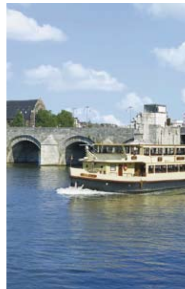
v Sint Servaasbrug

Dine beside the water or enjoy lunch in a church. In terms of location and cuisine, this gastronomic capital offers a rich smorgasbord of opportunities. No less than five restaurants bear the famous Michelin star, but you can find culinary quality at all price levels here. This is no surprise in a region where traditional craftsmanship is still very highly regarded and where a variety of local wines and cheeses are produced and sold in various specialty shops. Meet the local traditional craftsmen, and share their passion.