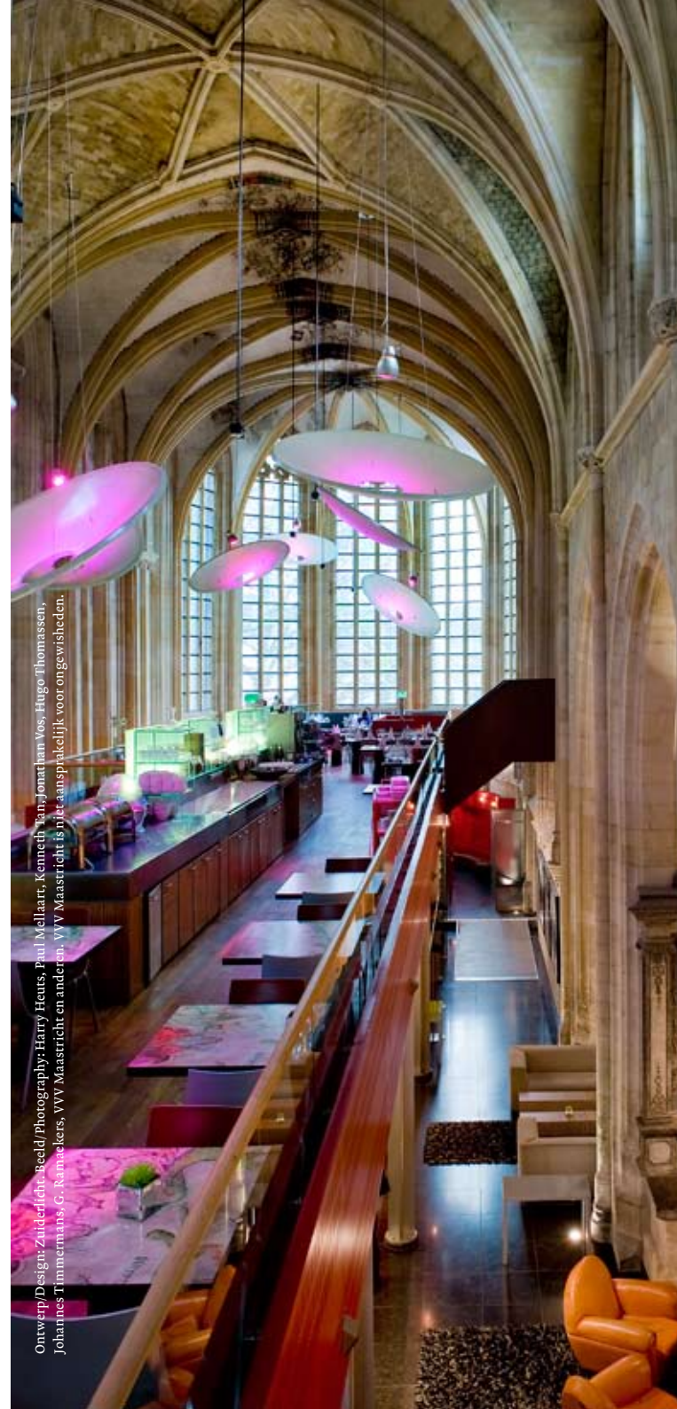
Onwerp/Design: Zaiichfab, VVV Maastricht is niet aansprakelijk voor ongewisdeden.