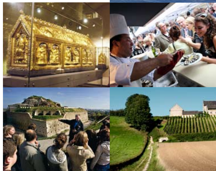
^ Fort St. Pieter

Maastricht can justly refer to itself as one of the oldest cities in the Netherlands. The city itself is a rich outdoor historical museum. All around you in the streets, you will find reminders of the Maastricht that once served as a Roman border checkpoint city, as a pilgrimage city in the Middle Ages, a garrison city, and as the city where the Dutch Industrial Revolution began. Europeans know Maastricht as the city where the Treaty of Maastricht was signed in 1992, leading to the birth of the euro. And Maastricht is still making history: Maastricht decided to compete for the title of European Capital of Culture in 2018.