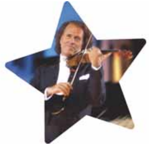
André Rieu auf dem Vrijthof