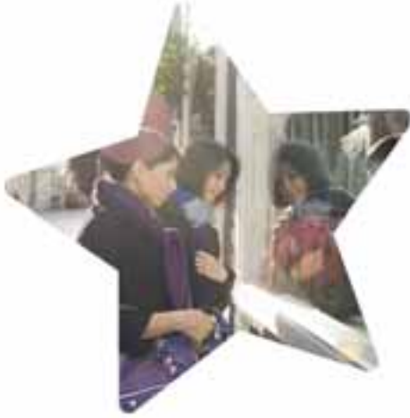
Shopping in Maastricht