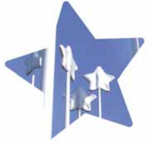
Stars of Europe